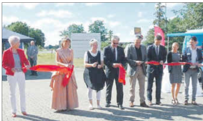
Eröffnung am Tag des offenen Unternehmens mit einem Banddurchschnitt