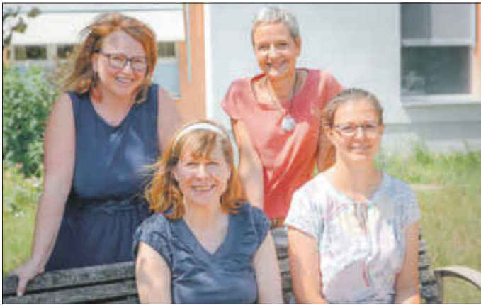
Das Team der EFB Forst, Foto: Archiv Naëmi-Wilke-Stift

Wenn es den Eltern gut geht, dann haben automatisch die Kinder etwas davon.