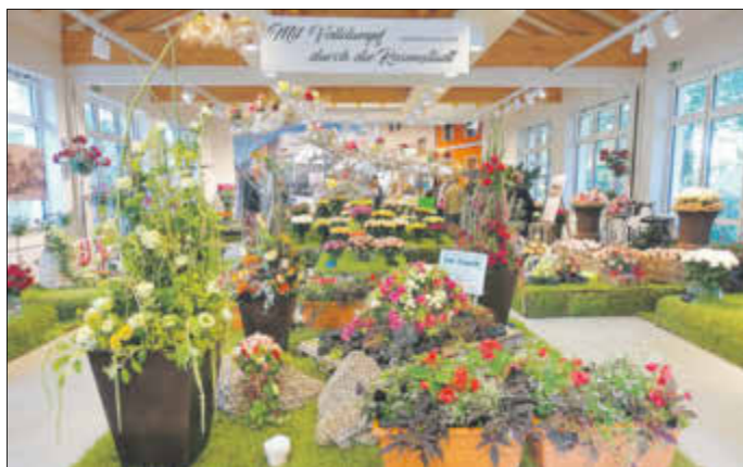
Die diesjährige Schnittrosenschau mit dem Thema „Mit Volldampf durch die Rosenstadt“ 125 Jahre Schwarze Jule

Insgesamt waren rund 11.000 Besucherinnen und Besucher an den Veranstaltungstagen der diesjährigen Rosengartenfesttage im Ostdeutschen Rosengarten Forst (Lausitz) zu Gast. Die Besucher kamen zum größten Teil aus Brandenburg, Sachsen und Berlin. Eine sehr große Resonanz war auch aus dem polnischen Nachbarland zu spüren. Die zahlreichen Gäste hatten sich auch durch ungünstige Wettervorhersagen nicht abschrecken lassen und konnten sich an abwechslungsreicher Unterhaltung, einem vielfältigen Rahmenprogramm und natürlich an der Pracht zehntausender blühender Rosen erfreuen.