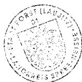
Simone Taubenek Hauptamtliche Bürgermeisterin

Hinweis: Der Wirtschaftsplan für das Wirtschaftsjahr 2020 und die Anlagen liegen zur Einsichtnahme bei der Stadt Forst (Lausitz) im Eigenbetrieb Kultur, Tourismus, Marketing Rosenstadt Forst (Lausitz) Promenade 9, Raum 308, während der Dienststunden öffentlich aus.