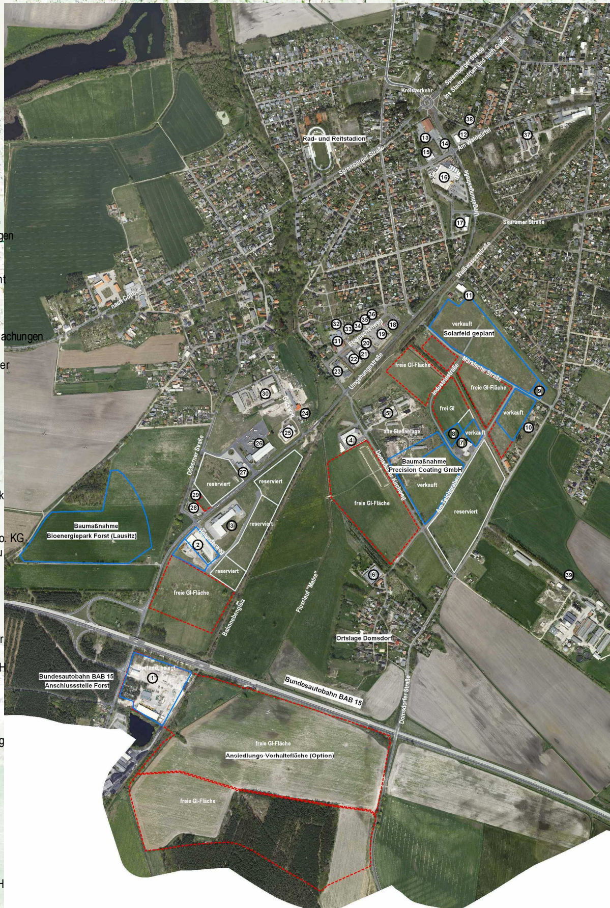
ÜBERSICHTSPLAN Industrie- und Gewerbegebiet Forst-Süd (Stand: 02/2010)