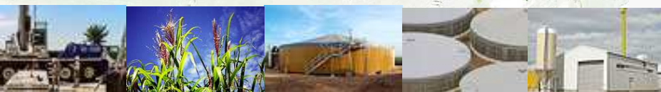
geplante Ansiedlungsfläche BioEnergie Park Forst

(Rückführung an Landwirtschaft u.a. zur Düngung geplant)